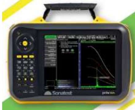
PRISMA UT dos canales P-E y transmisión con registro B y C Scan.

El Prisma es un equipo escalable en cualquier momento, con distintas opciones básicas de configuración: