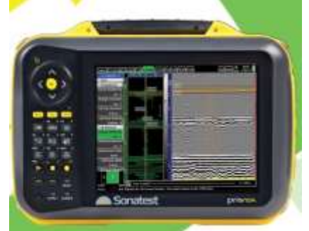
Opción TOFD y registro completo de datos en todos los casos.