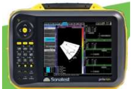
PRISMA PA Phased Array 16:16 ó 16/64 elementos dos canales P-E y transmisión.